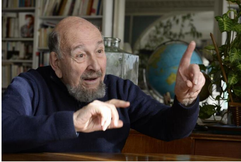
Şekil 1. Yves Lacoste, coğrafyayı farklı okuyan marjinal bir coğrafyacısıdır.

Yves Lacoste'un Türkçe'ye çevrilen kitapları ( Az Gelişmiş Ülkeler , İbni Haldun: Tarih Bilimin Doğuşu , Üçüncü Dünyanın Geçmişi , Coğrafya Her Şeyden Önce Savaş Yapmaya Yarar , Büyük Oyunu Anlamak , Jeopolitik: Bugünün Uzun Tarihi ) olsa da Türk akademiyasında bilinirliği istenilen düzeyde değildir. Söz konusu neden kapsamında bu makalenin hazırlanmasına karar verilmiştir. Makale kapsamında öncelikle Yves Lacoste'un kısa yaşam öyküsü ve başlıca eserlerine değinilecek sonrasında Yves Lacoste'un özgün coğrafi bakış açısından bazı örneklerle yer verilecektir.