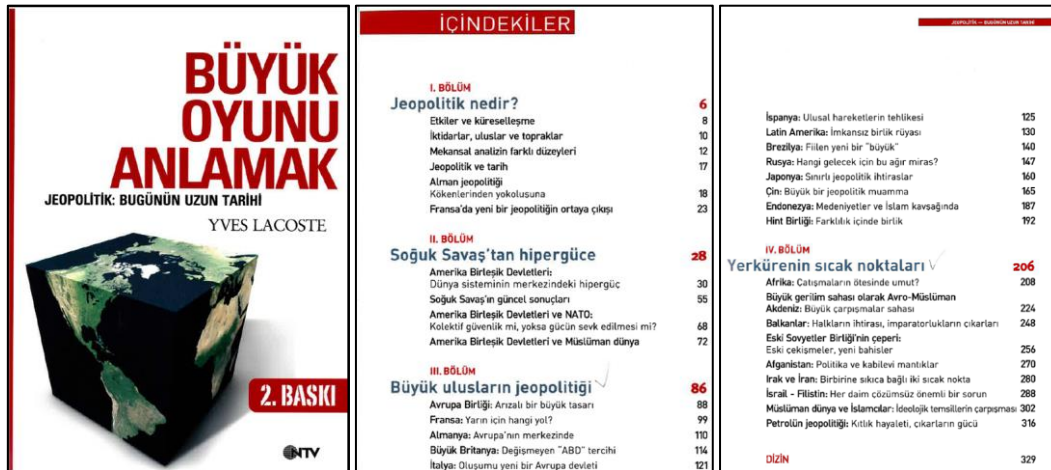
Şekil 2. Büyük Oyunu Anlamak kitabının kapağı ve içindekiler sayfaları (Lacoste, 2007).

Yves Lacoste insanın uzun süre ekonomiyi merkeze koyarak düşünmeye alıştırıldığından çatışmaların karmaşıklığını anlamakta zorluk çektiğini ve bu çerçevede dünyayı değerlendirmede yeni bakış açısına ihtiyaç bulunduğunu ifade etmektedir. Günümüzde jeopolitik teorilerden ziyade jeopolitik problemler (jeopolitik boşluk alanları) olduğunu ileri süren Lacoste, çözümün söz konusu problemlerin objektif olarak ortaya konması ile bulunabileceğini belirtmiştir (Lacoste, 1993).